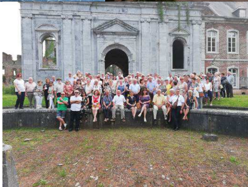
Notre Groupe en 2019